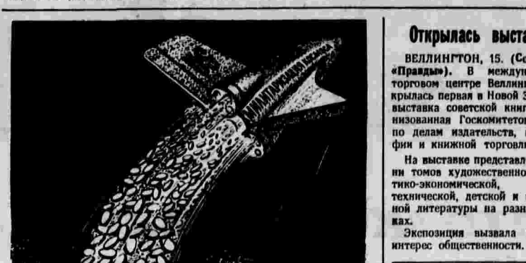
Космический подарок. Рисунок Б. Аржакаева.

газеты «Вашингтон пост» указывается, что от такой «шутки» «волосы встают дыбом». Выходка президента вызывает глубокую тревогу и возмущение, заявил в интервью ТАСС исполнительный директор Совета мира США М. Мейерсон. Так может жить маньякской идеей развязать ядерный конфликт. В действительности нынешний хозяин Белого дома отнюдь не шутит, когда речь идет о стремлении достичь ядерного превосходства и нанесении первого удара.