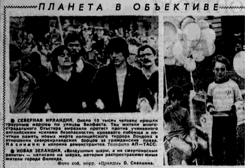
СЕВЕРНАЯ ИРЛАНДИЯ. Около 10 тысяч человек прошли демонстрацию на улицах Белфаста.

опасна. Это требует высокой бдительности от всех, кому дорог мир. Никакая псевдодемократическая риторика, к которой время от времени стал прибегать Вашингтон и в предвыборных целях, не должна вводить в заблуждение.