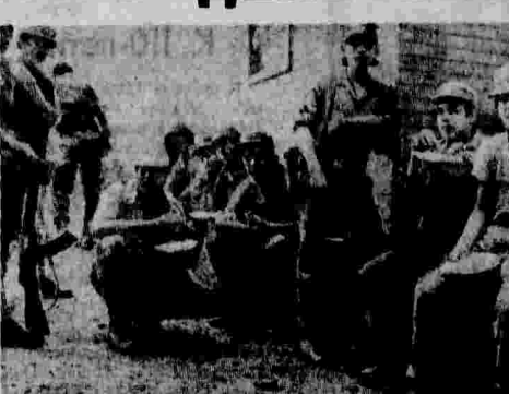
После того, как Гайана решила воспринять Гайану, которая была поддержана рядом государств — членом Карибского сообщества (КАРИКОМ), указал он, Вашингтон предпринял попытку исключить страну из регионального политико-экономического группировки. Эта попытка потерпела провал, однако оккупационные власти США широко клеветническая кампания против Гайаны продолжается.

канский авансонец «Джон Ф. Кеннеди». МАНАГУА, 15. (ТАСС). Администрация Рейгана проплатила Грешу и его семье контракт на подготовку к вооруженной войне в карибской стране, заявил бывший министр юстиции Грэнды, председатель руководящего комитета патриотического движения имени Мартина Лютера Кинга Рейдлин. В интервью журналу «Соборная» он указал, что оккупационные власти США пытаются вытравить идеалы революционных идеалов движения ДЖУЭЛ.